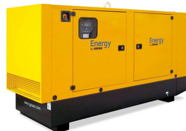
Модель кожухного исполнения

Для уточнения Длительной мощности - COP (ISO 8528/1:2005) консультируйтесь у вашего дилера GESAN