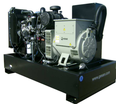
Модель открытого исполнения