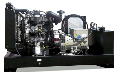
Модель открытого исполнения