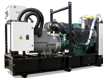
Модель открытого исполнения