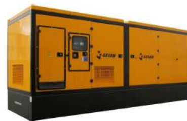
Модель кожухного исполнения

Для уточнения Длительной мощности - COP (ISO 8528/1:2005) проконсультируйтесь у вашего дилера GESAN