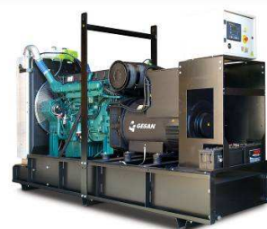
Модель открытого исполнения