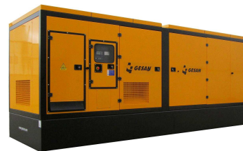
Модель кожухного исполнения