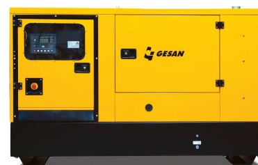
Модель кожухного исполнения

Для уточнения Длительной мощности - COP (ISO 8528/1:2005) консультируйтесь у вашего дилера GESAN