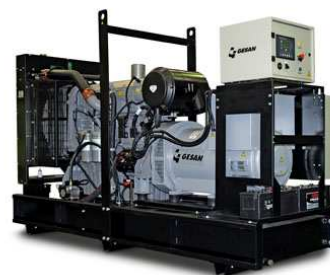
Модель открытого исполнения

Для уточнения Длительной мощности - COP (ISO 8528/1:2005) консультируйтесь у вашего дилера GESAN