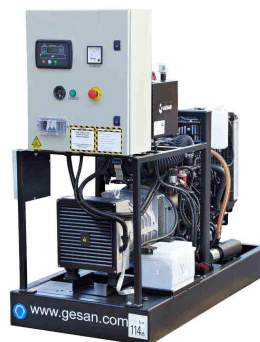
Модель открытого исполнения