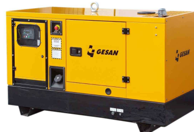
Модель кожухного исполнения

Для уточнения Длительной мощности - COP (ISO 8528/1:2005) проконсультируйтесь у вашего дилера GESAN