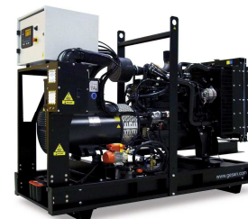
Модель открытого исполнения