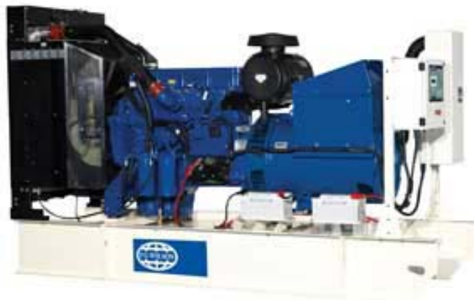
Рисунок приведен исключительно с иллюстративной целью