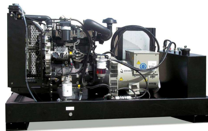
Модель открытого исполнения