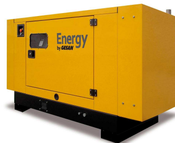
Модель кожухного исполнения