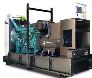
Модель открытого исполнения