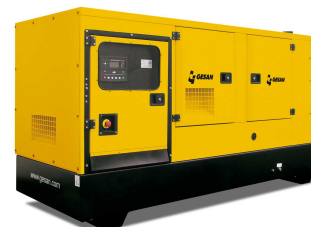
Модель кожухного исполнения

Для уточнения Длительной мощности - COP (ISO 8528/1:2005) консультируйтесь у вашего дилера GESAN