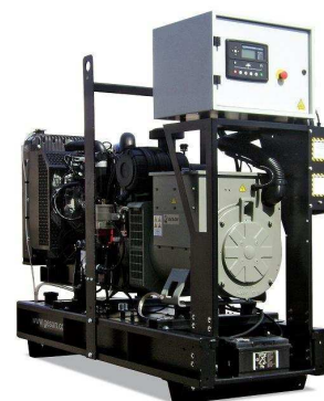
Модель открытого исполнения