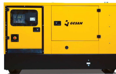
Модель кожухного исполнения

Для уточнения Длительной мощности - COP (ISO 8528/1:2005) консультируйтесь у вашего дилера GESAN